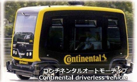
コンチネンタルオートモーティブ Continental driverless vehicle