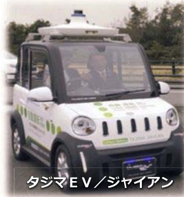
タジマEV/ジャイアン