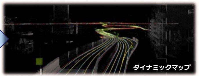
ダイナミックマップ