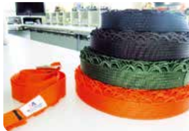
多機能細幅織物「ルーティー」

当社の取組みは静岡県が発行する「2013年度元気な企業実態調査報告書」でも紹介されています。