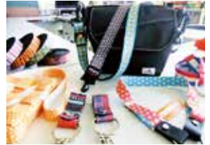
様々な細幅織物商品

現在、新たな細幅織物としてデザイン性と機能性を併せ持つ「ルーティー」を開発しています。