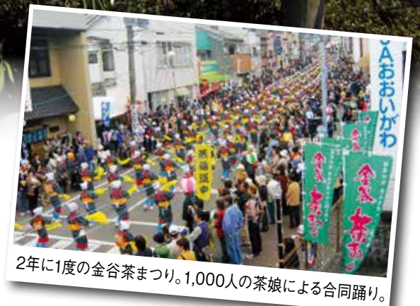
2年に1度の金谷茶まつり。1,000人の茶娘による合同踊り。