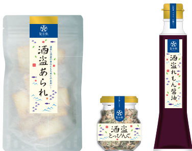
(株)カネヤマ水産「旨み舎 酒盗シリーズ」