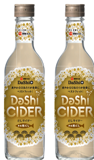
(株)柳屋本店「DaShi+ だしサイダー」