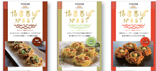
昭和ミート(株)「やきそば王国 やきそば NEST」