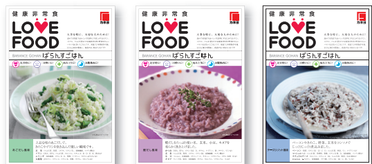
(株)カネヨ「健康非常食 LOVE FOOD ばらんずごはん」