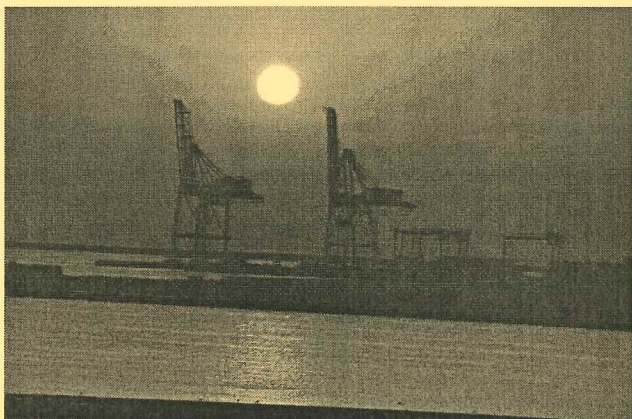
開港40周年入選 「港の夜明け」